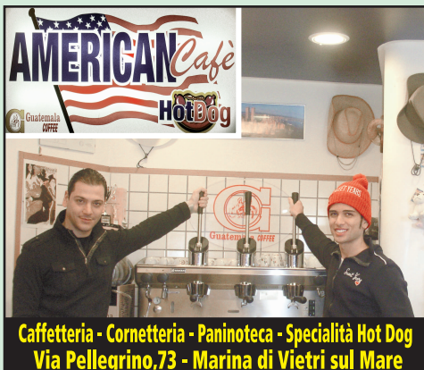
Caffetteria - Cornerteria - Paninoteca - Specialità Hot Dog Via Pellegrino, 73 - Marina di Vietri sul Mare